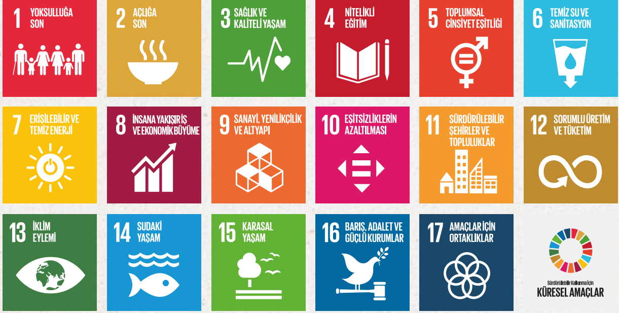
Şekil 1 - Birleşmiş Milletler Sürdürülebilir Kalkınma Amaçları (2015)

Sürdürülebilirlik kavramının hayata geçirilebilmesi ve hedeflenen sonuçlara ulaşılabilmesi için küresel düzeyde adımlar atılması büyük önem taşımaktadır. Bu bağlamda, Birleşmiş Milletler ve çok uluslu örgütler, sürdürülebilirliğin küresel gündemde sürekli yer alması ve uygulanabilirliğinin sağlanması konusunda kilit bir rol oynamaktadır. Sürdürülebilirlik sürecinde, iyi uygulamaların yaygınlaştırılması, olumsuz etkilerin önlenmesi, azaltılması ve sürdürülebilirliğin gündemde kalmasını sağlamak için stratejik bir yaklaşım geliştirilmesi gerekmektedir. Bu doğrultuda; yerel ve ulusal yönetimlerin hedef birliği içinde hareket etmesi amacıyla, temel sorunları ve konu başlıklarını kapsayan bir amaçlar seti oluşturulmuştur. Bu süreç, Birleşmiş Milletler'in 2000 yılında başlattığı Binyıl Kalkınma Hedefleri (Millennium Development Goals) ile başlamış; 2012 yılında düzenlenen Rio Konferansı'nda, 2015 yılında süresi dolacak Binyıl Kalkınma Hedefleri sonrası izlenecek stratejiler tartışılmıştır.